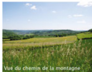
Vue du chemin de la montagne