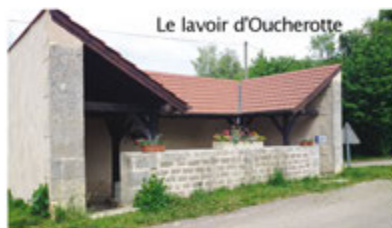
Le lavoir d'Oucherotte

Liste des hébergements, restauration et commerces à l'Office de Tourisme du Canton de Bligny-sur-Ouche et sur le site : www.ot-cantondeblignysurouche.fr