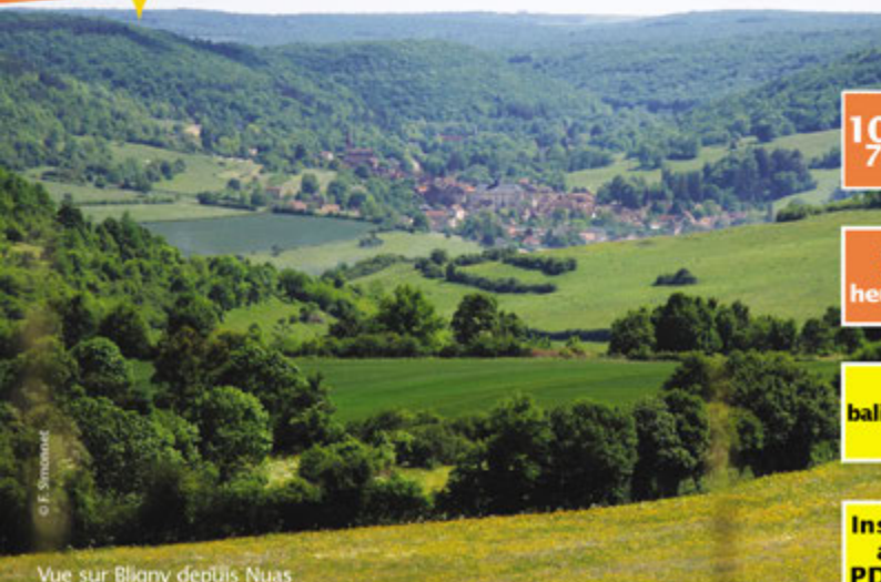
Vue sur Bligny depuis Nuas