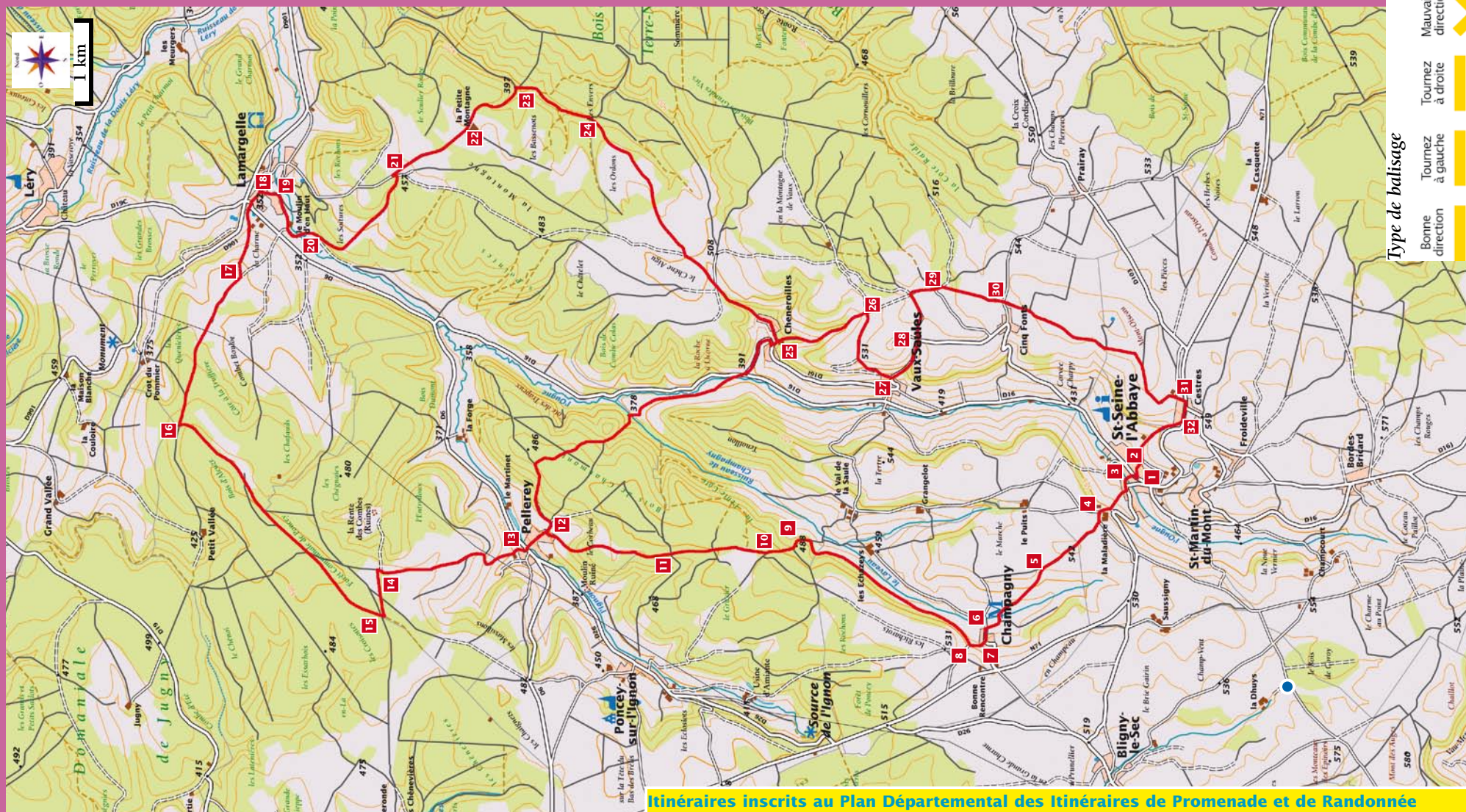
Itinéraires inscrits au Plan Départemental des Itinéraires de Promenade et de Randonnée

Toute reproduction ou adaptation, sous quelque forme et par quelque procédé que ce soit, même partielle, interdite pour tous pays.